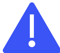
Threat Intelligence Based Ethical Red-teaming (TIBER)